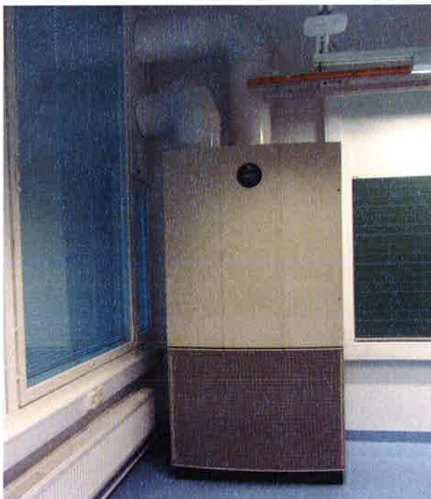
Kuva 1. Luokkatilan ilmanvaihtokone

Luokissa oli omat ilmanvaihtokoneyksiköt, merkiltään PM Luft, joiden tilavuusvirraksi oli käsin kirjoitettu "plus, miinus 280 l/s" (kuva 1). Luokkatiloja yhdistävällä käytävällä (B102) oli IV-piirustusten mukaan 3 kpl tuloilmapäätelaitteita ja 2 kpl poistoilmapäätelaitteita. Käytävän ilmanvaihto oli pois päältä siiven toisen päädyn korjausten vuoksi, joten ilmanvaihdon toimintaa ei voitu arvioida. Toimitetun asiakirjan (Raksystems 10.8.2017) mukaan poistoilma kulkeutuu luokkien ovirakojen kautta luokkiin.