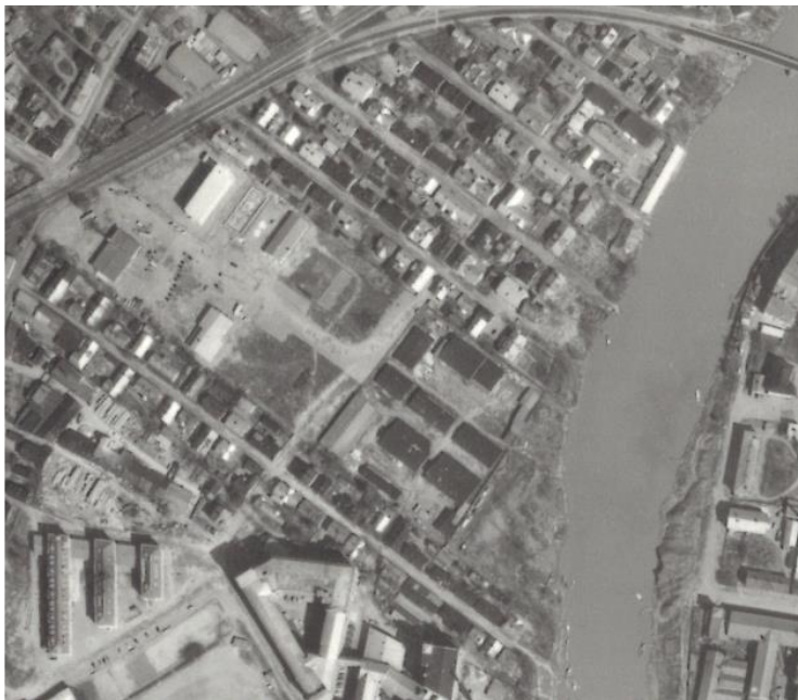
Ilmakuva vuodelta 1960. Ketarantie ja asutus sen varrella jatkuvat edel- leen jokeen saakka. Kaavassa kadun joen puoleinen osuus on ollut kuiten- kin jo pitkään varattu kehätielle ja te- ollisuuskäyttöön.

Helsinginkatu ja siihen liittyvä Tuomaansilta kaavoitettiin 1990-luvulla samaan aikaan, kun aluetta alettiin muuttaa teollisuudesta asuinkäyttöön. Vanhaa kehäväylän linjausta siirrettiin korttelin verran pohjoiseen Verkatehtaankadulta Sorsantielle, joka oli entistä puutarha- maata teollisuushallien välissä. Sorsantie kaavoitettiin 1955 ja kaavaan sisältyivät korttelit 40 ja 41. Sorsantie oli keskeltä levennetty, ja tämä levennys näkyy edelleen Helsinginkatu 22–27:n teollisuusrakennusten sisäänvetoina. Tuomaansilta ja Helsinginkatu rakennettiin 1998–99.