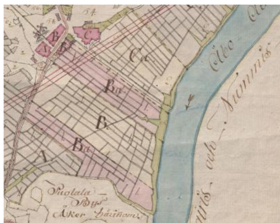
Raunistulan isojakko 1796. Maistraatin palkkatila Lonttinen on merkitty kirjaimella B. Akatemialle kuuluneen Vätin maat on merkitty A:lla.

Ketarantien ja Lokinkadun välinen alue liitettiin Turkuun Maarian kunnan alueliitoksen osana 1944. Alue oli Lonttisten ja vuodesta 1790 alkaen siitä lohkotun Ylilonttisten sekä Väti talojen hallussa. Ketarantien puoli kuului Vättille talolle. Nykyisen Aninkaistensillan kohdalla oli Aninkaistentulli kaupungin ja Maarian rajalla. Tullin yhteydessä oli tullipelto, joka kuului Alilonttisille. Lonttinen ja Vätti kuuluivat Raunistulan kylään, jonka talot olivat ylempänä Virusmäentiellä. Tasainen ja alava, jokeen laskeva maa on ollut maatalouskäytössä. Kylämäelle syntyi 1800-luvun loppupuolelta alkaen esikaupunkiasutusta, joka levittäytyi Aninkaisten ja Raunistulan väliselle peltomaalle 1800- ja 1900-lukujen vaihteessa.