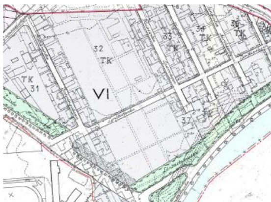
Ote asemakaavasta 8/1946.