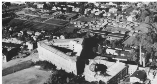
Verkatehtaan ympäristöä etelästä kuvattuna. Vasemmalla keskellä näkyvät Ketarantien puutalot, joiden yläpuolella kaupunginpuutarhan alue. Ylhäällä ovat Lokinkadun puutalokorttelit. Kuva on ilmeisesti 1950-luvulta. Valvillan tehdasmuseon valokuvakokoelma.