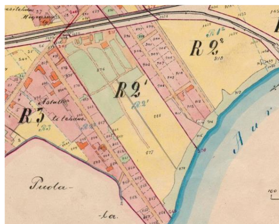
Raunistulan isojaon järjestely 1906. Ylilonttisten maat R2 1, Alilonttisten R2 2 ja Vätin R3. Keskellä erottuu Maarian puutarha ja sen rakennuskanta radan varressa. Ketarantien pohjoispään eteläpuolella on Turun Asfaltitehdas. Puutarhaa ympäröivät linjakadut pienine palstatiloineen.