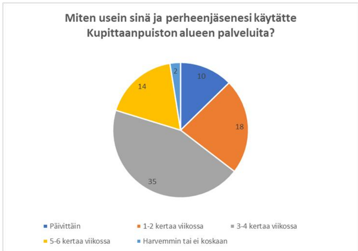
Kuvio 1. Miten usein käytät alueen palveluita

Kuviosta 1 huomataan, että vastaajat ovat Kupittaaanpuiston alueen palveluiden aktiivisia käyttäjiä, sillä lähes 75 % vastaajista kertoo käyttävänsä niitä 3 kertaa viikossa tai useammin.