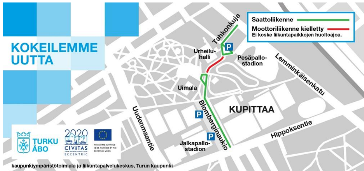
Kuva 1. Kupittaaanpuiston kokeilu

Ennen kokeilua puiston ja liikuntapaikkojen käyttäjien turvallisuus vaarantuu etenkin Kupittaaan urheiluhallin edustalla. Erityisesti jalankulkijoille ja pyöräilijöille aiheutui vaaratilanteita. Noin vuoden mittaisessa kokeilussa kokeiltiin, miten autoliikenteen rauhoittaminen urheiluhallin edustalla vaikuttaa hallin ja puiston turvallisuuteen, käytettävyyteen ja viihtyisyyteen. Kokeilun aikana ainoastaan liikuntapaikkojen huoltoliikenne sallittiin Kupittaaan urheiluhallin edustalla.