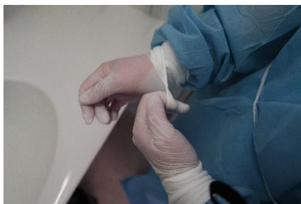
1) Suojakäsineiden riisuminen

Käytetyt suojaimet laitetaan roskapussiin. Roskapussit pakataan huoneen ulkopuolella toiseen puhtaaseen pussiin ja laitetaan polttokelpoiseen jätteeseen.