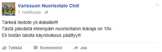
Kuva 4. Varissuon nuorisotalon Facebook-sivulla ilmoitettiin tiukentuneista ikärajoista (21.10.2015). 41