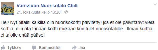
Kuva 5. Nuorisokortti on Turussa edellytys nuorisotaloilla käymiselle (21.10.2015). 41

Kesällä ja syksyllä 2015 keskustelin nuoriso-ohjaajien kanssa nuorisokortin vastaanotosta nuorten keskuudessa ja tuntuma oli, että nuorisokortti on otettu vastaan Turussa hyvin. Myös saamieni kyselyvastausten mukaan nuorten käymättömyys johtui muista seikoista (ks. yllä). En kuitenkaan kysynyt juuri tätä asiaa erikseen. Vaatimus jäsenkortin hankkimisesta voi olla kynnyksikysymys sellaiselle nuorelle, joka ei halua liittyä jäseneksi tai antaa tietojaan. Nuorten yleinen suhtautuminen jäsenyyksiin on vuonna 2013 ilmestyneen vapaa-aikatutkimuksen 27 mukaan kielteistä: 10–29-vuotiaista jopa 72 prosenttia oli sitä mieltä, että ”toimintaan on mukava osallistua, jos ei tarvitse liittyä jäseneksi