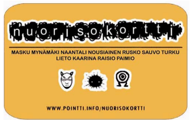
Kuva 3. Tampereen kaupungin klubikortti nuorille vuonna 2013–2014 ja Turun seudun nuorisokortti 2016. 37,40