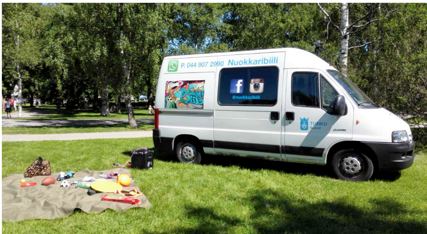
Kuva 2. Nuokkaribiili Kupittaaan puistossa.