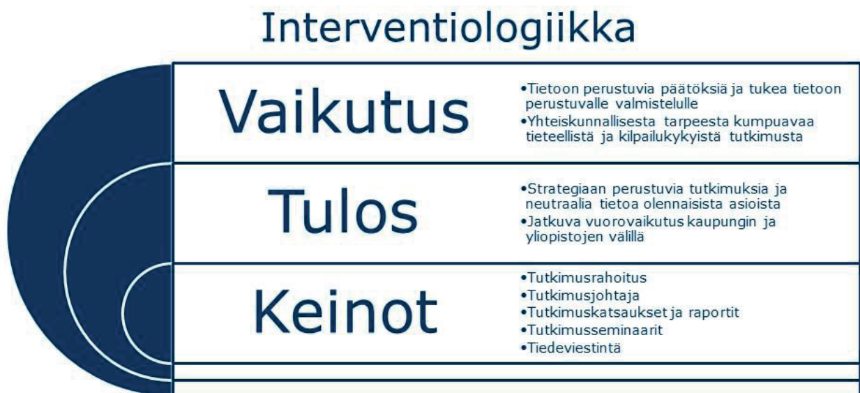
Kuva 2. Turun kaupunkitutkimusohjelman interventioogiikka.

Realistinen arviointi ottaa ohjelman tavoitteiden, prosessien ja havaittujen vaikutusten lisäksi huomioon tulkinnat siitä, miksi jokin asia tai toimintatapa ei kehittynyt toivotulla tavalla. Etenkin tulkinnat tutkimusohjelman vaikuttavuutta tukeneista tai vaikeuttaneista tekijöistä ovat olennaisia, jotta tulevaisuuden toimintatapojen suunnittelussa voidaan oppia kokemuksista. Koska kyseessä on kaupunkien kehittymisen kannalta olennainen elementti, parhaiden koke-